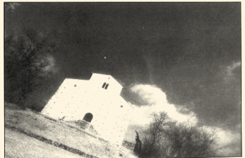
La facciata della Pieve di S. Pancrazio. Dalla doppia scalinata, ideale pulpito per diffondere la voce su tutto il Borgo, si gridavano i sinistri e a volte crudeli “accoppiamenti” di Ciòca Màrs.

Come delinquenti colti sul fatto, ci dividemmo e sparimmo dalla circolazione sul monte per giorni e giorni.