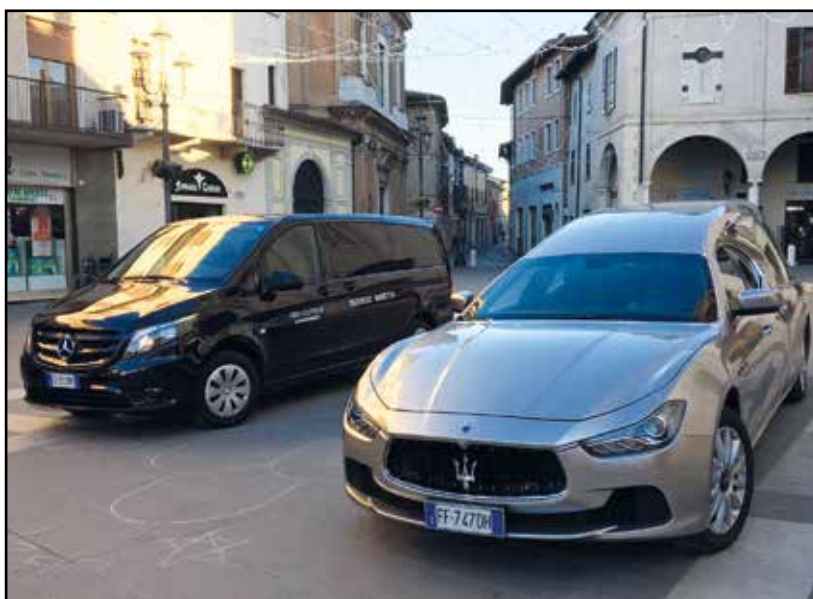
Il pulmino Mercedes con 9 posti a disposizione dei familiari.

Non c'è che dire l'esperienza e la professionalità sono al servizio dei cittadini.