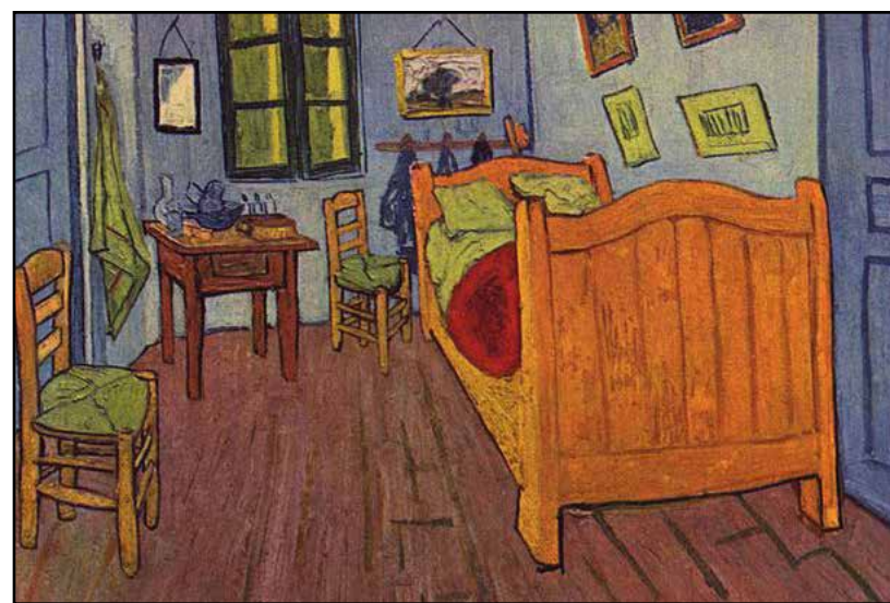
Il famoso dipinto di Vincent Willem Van Gogh.

Questo "sdoppiamento" della casa inizialmente mi ha lasciata in quello che mi piace chiamare un circolo vizioso di nostalgia , che implicava che ovunque io fossi pensassi a quanto mi stavo