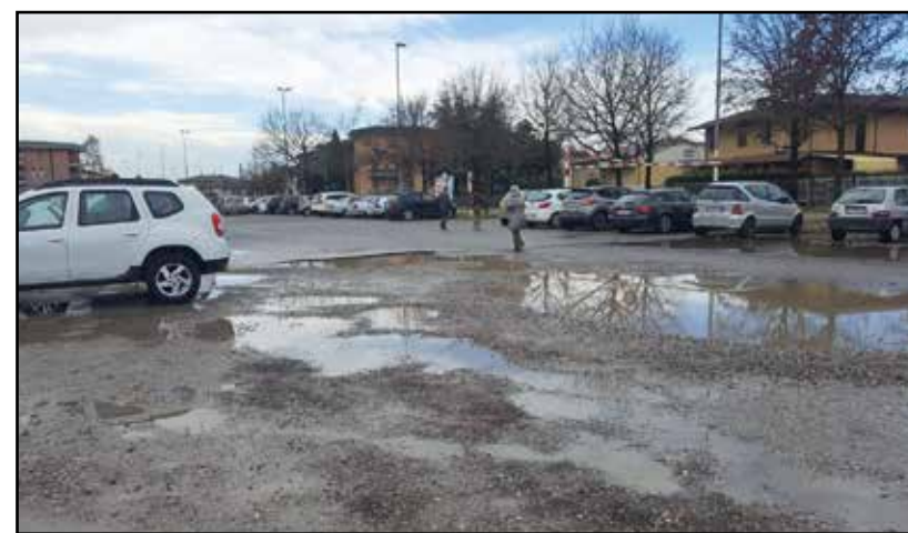
Il parcheggio d'entrata all'ospedale.

Quindi massima attenzione all'annuncio dei finanziamenti per sollecitare l'opera che deve essere realizzata in tempi strettissimi.