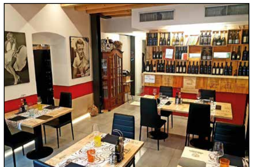
La sala d'ingresso del ristorante.