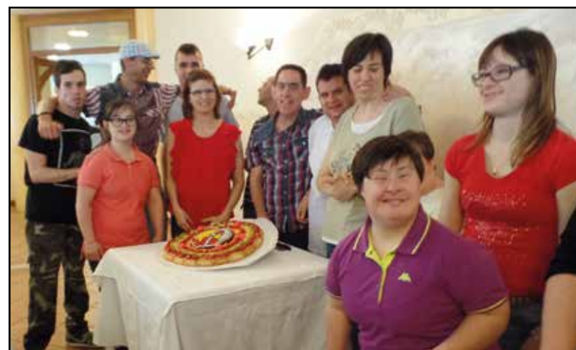
Giovani interessati al Dopo di Noi.

L'Associazione cerca adesioni al fine di ingrossare la propria consistenza, per realizzare la sua missione dando risposte concrete al "Dopo di Noi" acquistando una abitazione per prendersi concretamente cura dei ragazzi, quan-